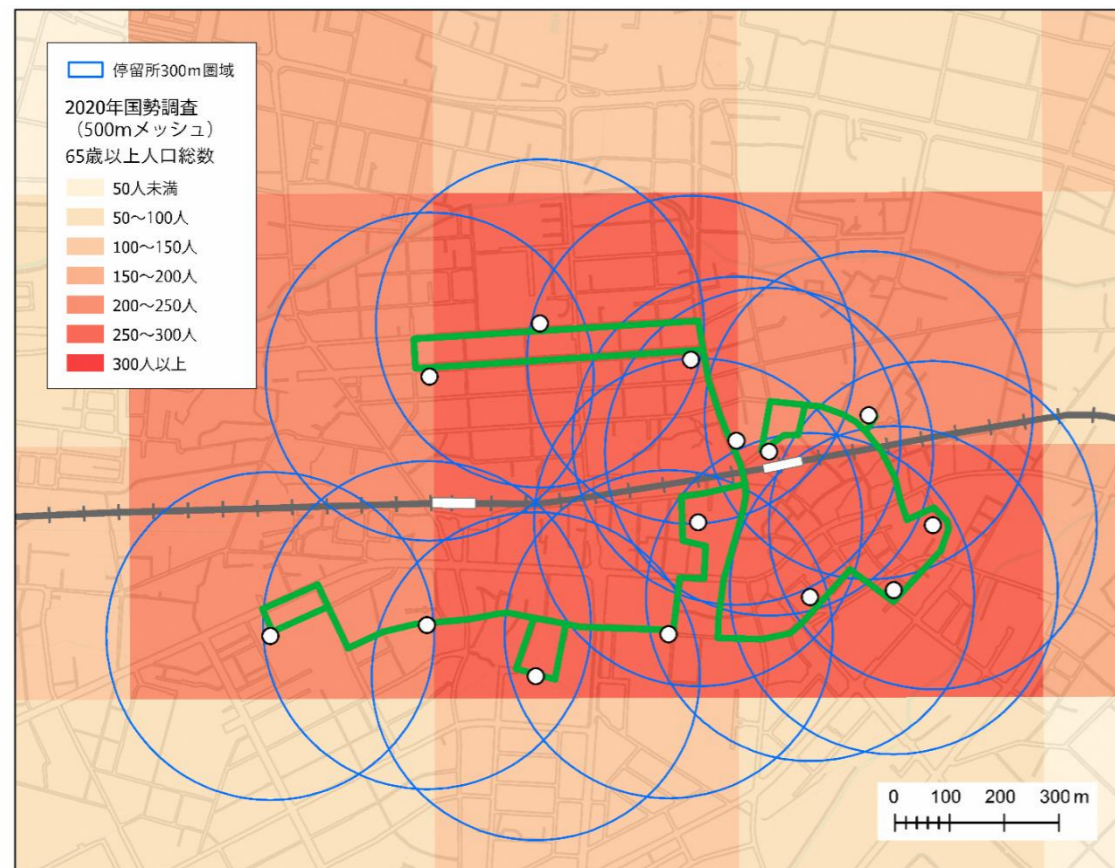
図 電動ミニバスの利用圏域図